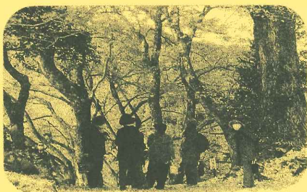
時には「清徳寺」へ紅葉狩り↑ 恒例のフラワーアレンジメント↓

いきいき教室は、用瀬地域の介護予防を必要とする在宅の高齢者に対し、「ふれあいの場」を提供するとともに、生きがいと仲間づくり及び心身機能の維持向上を図ることを目的として行っています。